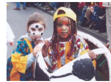
Abb.2: S.O.S. Kinderdorf e.V.